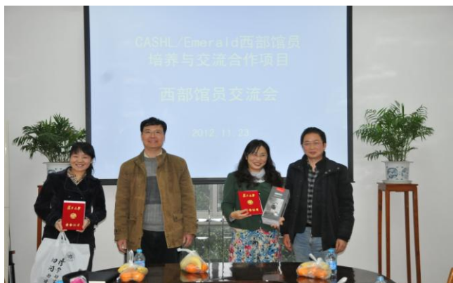
图为严书记、杨馆长与向西部馆员颁发证书

在复旦大学培养基地期间，复旦大学根据2位西部馆员的专业背景、工作经历和访问计划，量身定制了周